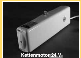
Kettenmotor 24 V