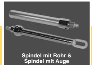
Spindel mit Rohr & Spindel mit Auge