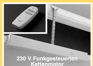
230 V Funkgesteuerten Kettenmotor