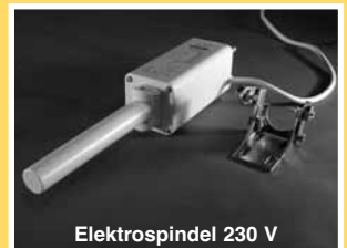
Elektrospindel 230 V