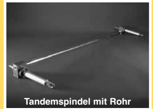
Tandemspindel mit Rohr